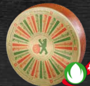
Bio surchoix 4 à 5 mois d'affinage savoureux corsé