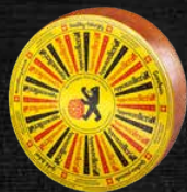
Surchoix 4 à 5 mois d'affinage savoureux corsé