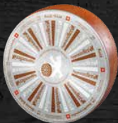
¼-gras Racé 6 à 8 mois d'affinage racé et corsé