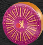
Raffiné 9 mois d'affinage raffiné et corsé