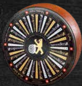
Extra 6 mois d'affinage extra-fort