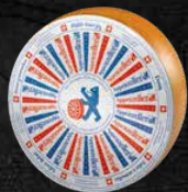
Doux 3 mois d'affinage doux et aromatique

Les best-sellers dans les quatre saveurs les plus appréciées.