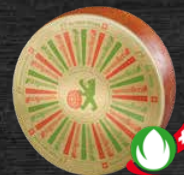
Bio doux 3 mois d'affinage doux et aromatique