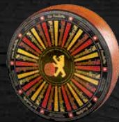
Pour Raclette 4 à 5 mois d'affinage savoureux corsé