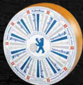
Fromage à la crème 3 mois d'affinage crémeux et corsé

Associer des recettes éprouvées à de nouvelles idées, c'est une longue tradition chez Appenzeller®.